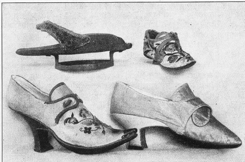
Abb. 1. Frauenschuhe des 16. bis 18. Jahrhunderts.

Im 14. Jahrhundert reichten die Schuhe bis oder wenig über die Knöchel herauf; der Verschluss wurde durch Querbänder, Verschnürung und Spangen bewerkstelligt; ihr Material be-