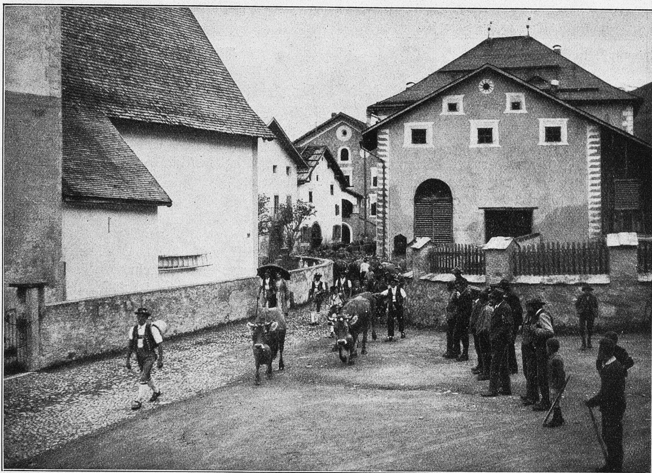
Alpfahrt bei Guarda.

verschneiten Walde hausenden Wilden Mann, den König des Waldes, einzufangen. Meistens wurde er ohne Gewaltmaßnahmen einfach herbeigelockt. Man stellte einen Tisch mit Wein ins Freie. Dann spielte die Blechmusik der ganzen Talschaft — verlockend, bezaubernd in gleichmäßigem Rhythmus. Sie lockte den Wilden Mann herbei, er kam scheu und zögernd immer näher, bis an den Tisch heran, trank ein Glas Wein, warf das leere Glas in den Bach und sprang in den Wald zurück. Man schoß ihm nach, er blieb mit einer Fußwunde liegen. Die Braut, weiß gekleidet, mit einem weißen Kranz im Haar, die heim Stamme wartete, verband ihm die Wunde. Der Wilde Mann wurde nun gefesselt und mit Ketten am Fuß des Stammes angebunden. Sein Kleid bestand vom Kopf bis zu den Füßen aus Tannzapfen, Baumflechten und Zweigen. Der Stamm wurde sodann auf einen Bockschlitten gebunden. Das Volk stellte sich hinter diesem auf. Nun begann das Blockziehen. Achtundzwanzig kräftige Jünglinge zogen an Stricken den Schlitten. Der Wilde Mann wurde nachgeschleift. Vorn saß ein Fuhr-