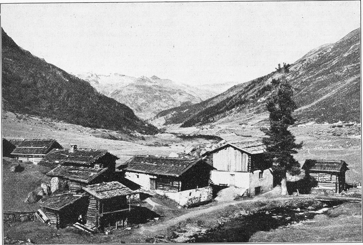
Die Alp am Rhin im Dischmatal.