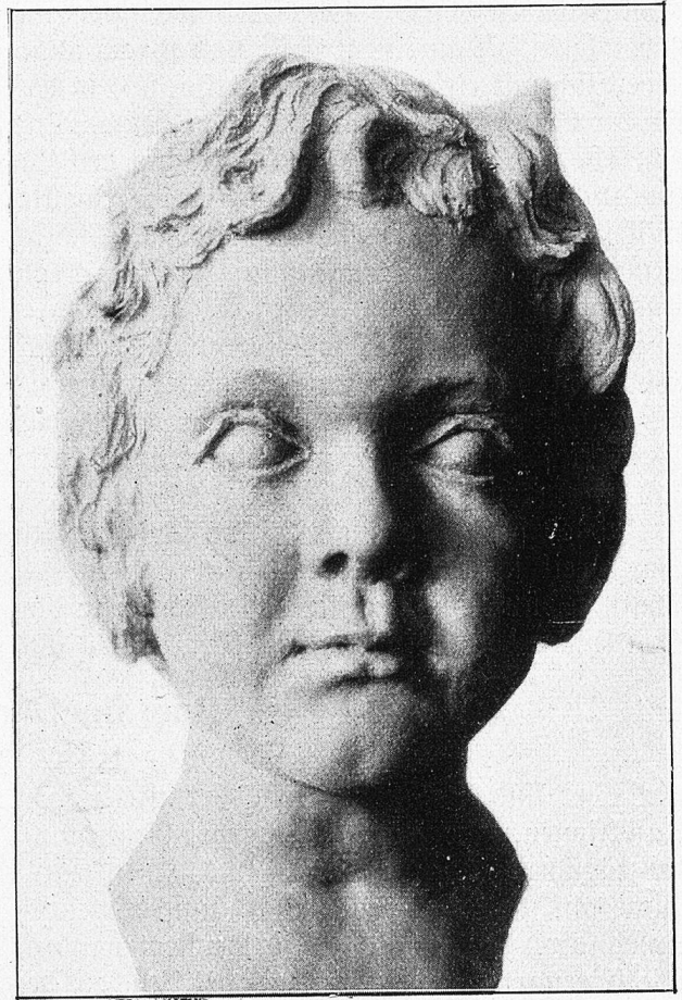
Kinderbüste. Von P. Bonbun.

sen vollauf Rechnung trug, sondern auch noch manches im Gefolge hatte, das sich der Laie so gerne als zum Künstlertume gehörig ausmalt, das aber, müßte er es selbst erleben, ihm etwas weniger behagen würde. Aber der junge Bildhauer ließ sich durch diese ernsteren Seiten des Daseins in seinem Drang nach vorwärts kaum anfechten. Im Sommer 1922 brach er seine Zelte hier ziemlich unvermittelt ab und begab sich auf eine Studienreise nach dem ihn anlockenden Deutschland.