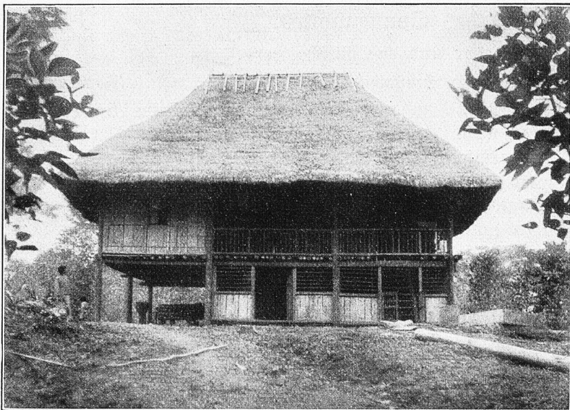
Von Jumbo-Indianern erbautes Kolonistenhaus in Archidona.

Schwester und Patres von dem Josefinerorden in Turin der Seelsorge obliegen. Da ich von den Geistlichen Auskunft über die Möglichkeiten der Schifffahrt auf dem Napo zu erhalten hoffte, entschloß ich mich trotz der vorgerückten Stunde, den Patres einen Besuch zu machen. Sie hatten eben das Nachsteffen beendet und empfingen mich, besonders da ich italienisch sprach, sehr freundlich. Gerne gaben sie mir die gewünschten Auskünfte über den Napo und die Siedlungen der Indianer und zur Feier des Tages servierten sie ein allerdings sehr kleines Gläschen selbstgezogenen Weines. Neben der Seelsorge betätigen sich die Missionare vor allem als Krankenpfleger und suchen die Indianer, soweit ihnen dies möglich ist, vor der ärgsten Ausbeutung durch die Kolonisten zu schützen. Zur Zeit meines Aufenthaltes saßen aber gerade die Liberalen am Ruder und so fanden sie bei der Regierung in Quito für ihre wohlgemeinten Bemühungen wenig Gegenliebe. Da, wie bereits erwähnt, in Tena auch eine Anzahl Schwestern der Missionstätigkeit oblagen, interessierte es mich zu erfahren, wie diese nach dem Oriente gekommen seien. Eine Reise über die Kordillere und die Sumpfwälder ihrer Ostabhänge geht nämlich meist bis an die Grenze der physischen Leistungsfähigkeit eines kräftigen Mannes, und so schien es mir kaum glaublich, daß frisch zugereiste Europäerinnen auf diesem Wege Tena zu erreichen vermochten. Und doch war dem so. Auf meine Frage gab mir einer der Patres, der die Schwestern in Riobamba