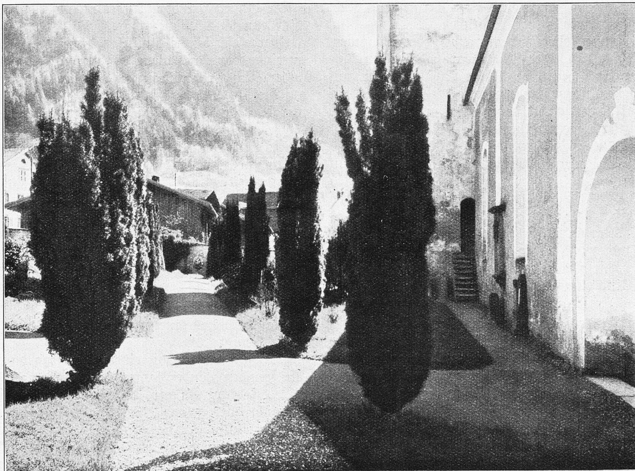
Malans. Stimmung auf dem Friedhof.