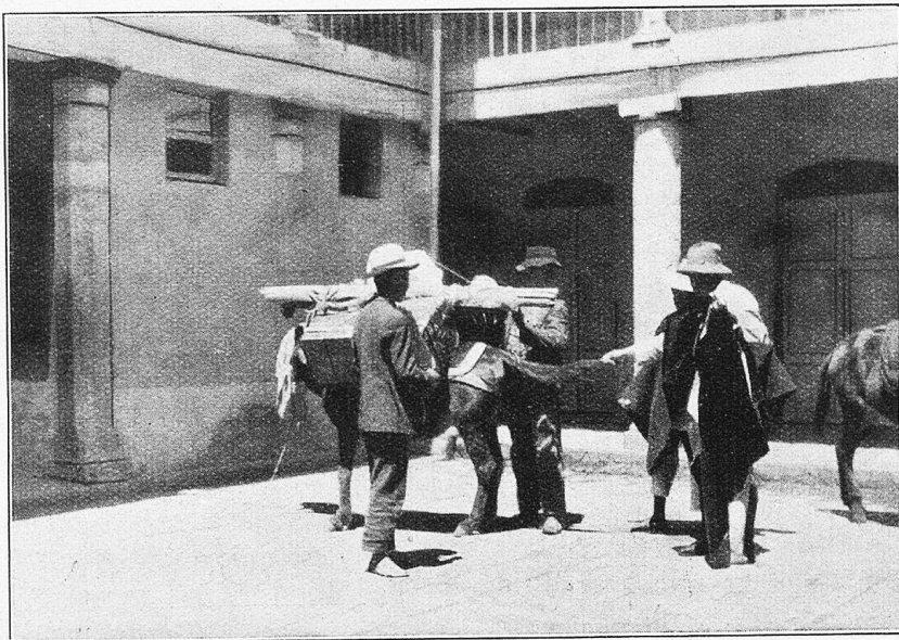
Quito. Vorbereitungen zur Abreise über das Huamanigebirge.

derung wohl nicht zu lange mehr auf sich warten lassen werde.