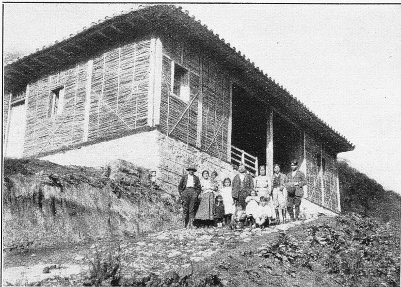
Regierungstambo in Papallacta.

Gegen vier Uhr nachmittags endlich erblickten wir nach einem letzten steilen Anstieg in 4200 Meter Höhe zu unseren Füßen ein tiefeingeschnittenes, von Süden nach Norden verlaufendes Tal, an dessen Ausgange, unsern Blicken zwar noch verborgen, das Dorf Papallacta liegt. Leider senkt sich das Gebirge gegen Osten viel allmählicher als gegen Westen, so daß sich auf dieser Seite eine Reihe sumpfiger Hochflächen finden, deren Durchquerung schon zu Fuß, geschweige denn mit Mantieren, eine außerordentliche Anstrengung bedeutet. Wir suchten infolgedessen, diese Sümpfe vermeidend, den sie umsäumenden Steilhängen entlang zu ziehen. Allein der mit Neuschnee bedeckte Boden erwies