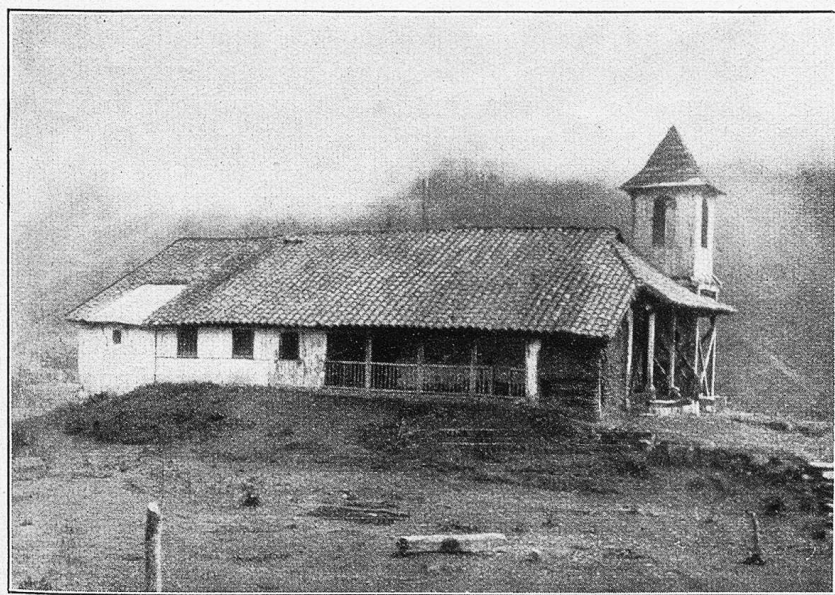
Kirche in Papallacta (3200 m).

Dieser das Tal absperrende Lavaström hat eine Breite von sechzig bis achtzig Meter und ist an seinem Ende zu hohen, wild zerborstenen Schollen aufgetürmt, die mit ihrer pechschwarzen Farbe in der dämmerigen Abendbeleuchtung einen recht unheimlichen Eindruck machten. Mit schmerzenden Gliedern, halb erfroren und erschöpft, er-