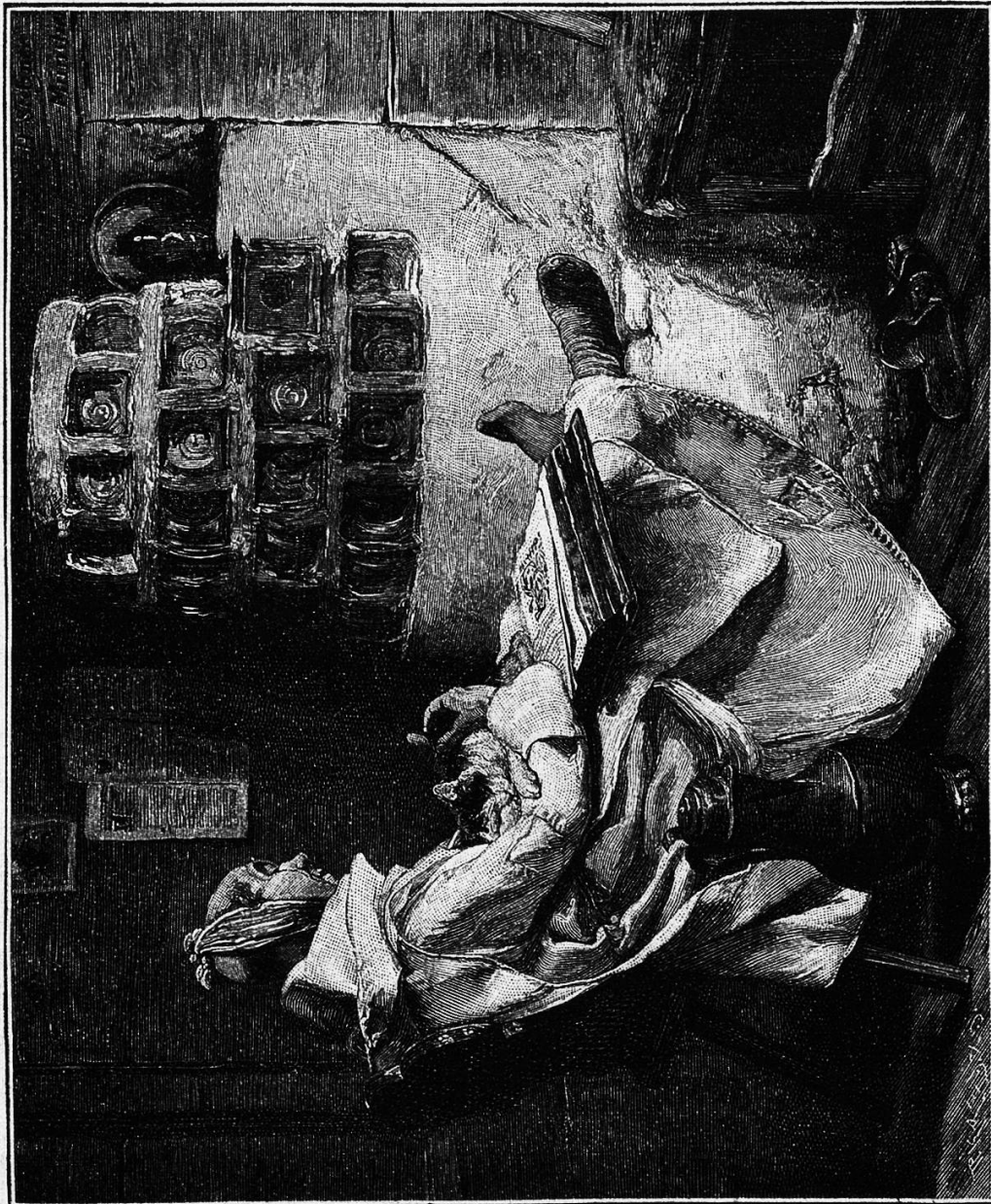
Freudvoll und leidvoll. Nach einem Gemälde von H. Stelzner.