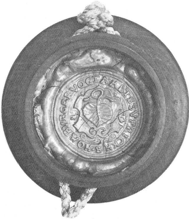
Abb. 4. Homburger Vogteisiegel, 18. Jahrhundert.

schriftlich belegt. Es mag sein, dass dieses Wappen sowohl für die Franzosen als auch für die Österreicher unverfänglich war und zudem innenpolitisch von den Anhängern der alten wie auch der neuen Ordnung als neutral erachtet wurde. Möglich ist auch, dass mit dieser Wahl die Rivalität der beiden Verwaltungsstädte Rheinfelden und Laufenburg überbrückt wurde. Sehr wahrscheinlich ist aber, dass man sich im Fricktal auf «sein» Wappen besann und ebenso wie der 1798 gebildete Kanton Baden auf das überlieferte Wahrzeichen zurückgriff (Abb. 5).