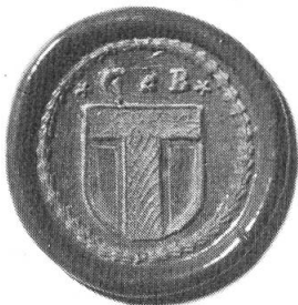
Abb. 5. Siegel des Kantons Baden 1798, Staatsarchiv Aarau.

schriftlich belegt. Es mag sein, dass dieses Wappen sowohl für die Franzosen als auch für die Österreicher unverfänglich war und zudem innenpolitisch von den Anhängern der alten wie auch der neuen Ordnung als neutral erachtet wurde. Möglich ist auch, dass mit dieser Wahl die Rivalität der beiden Verwaltungsstädte Rheinfelden und Laufenburg überbrückt wurde. Sehr wahrscheinlich ist aber, dass man sich im Fricktal auf «sein» Wappen besann und ebenso wie der 1798 gebildete Kanton Baden auf das überlieferte Wahrzeichen zurückgriff (Abb. 5).