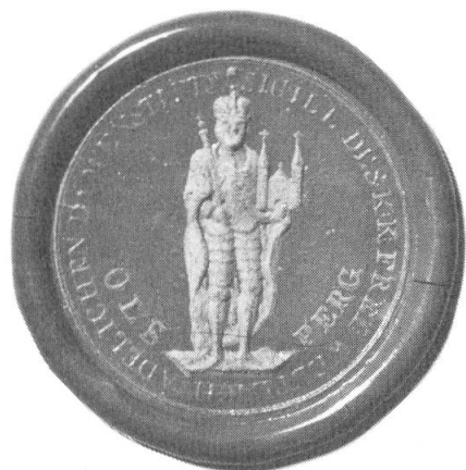
Abb. 3. Siegel der Abtei Olsberg, 18. Jahrhundert, Staatsarchiv Aarau.

erhalten. 15 Monate bleibt das Fricktal von französischen Truppen besetzt.