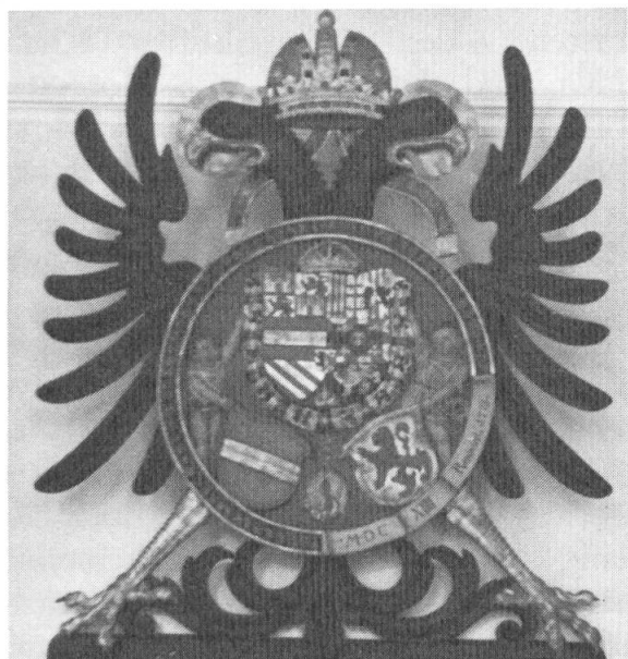
Abb. 1. Wappentafel Kaiser Matthias' im Gerichtssaal zu Laufenburg 1614 (renoviert 1771).

Der Bevölkerung ergeht es wie den rechtsrheinischen Verwandten; häufige Belagerungen und Kriegszüge mit spär-