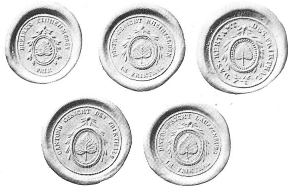
Abb. 6. Wappensiegel des Kantons Fricktal 1802/03 (Staatsarchiv Aarau): a) Bezirks Einnehmerey Frik; b) Distr. Gericht Rheinfelden im Frikthal; c) Das Rentamt des Frikthal; d) Cantons Gericht des Frikthals.