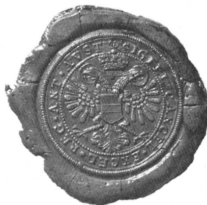
Abb. 2. Siegel der vorderösterr. Regierung, Staatsarchiv Aarau.