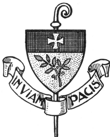
Fig. 6. Abbaye de Maredsous

se rattachaient les premiers moines de la fondation valaisanne 35 . Enfin, le blason de cette dernière se complète d'une devise bien choisie, car elle évoque encore le nom de Port-Valais en même temps qu'elle est chargée de signification spirituelle : IN PORTUM VOLUNTATIS TUAE, devise adaptée du psaume 106, verset 30.