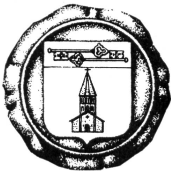
Fig. 3. Saint-Pierre-de-Clages

Toutefois, des étiquettes de bouteille pour les vins du « Prieuré » 16 portent l'image d'un sceau présentant un blason qui voudrait être un blason propre pour le prieuré de Clages (fig. 3). Les couleurs ne sont pas indiquées, mais on peut, semble-t-il, les présumer : [d'azur] à la facade de l'église priorale [d'argent], au chef [de gueules] chargé de deux clefs : l'une [d'or]