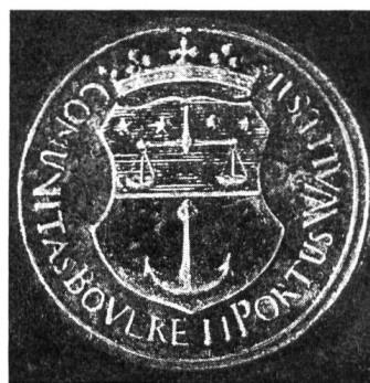
Fig. 4. Commune de Port-Valais

Les armes de la commune de Port-Valais sont anciennes et évoquent fort bien l'histoire du lieu: coupé: au 1 d'azur à une balance d'or, accompagnée en chef de quatre étoiles à cinq rais du même, rangées en fasce; au 2 de sable à une ancre d'argent . L'ancre représente le toponyme: Port