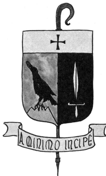
Fig. 7. Dom Bonaventure Sodar

Les armes du nouvel abbé (fig. 7) se présentent ainsi : parti : au 1 d'or à un corbeau de sable sur une montagne de trois coupeaux de sinople, tenant en son bec un pain au naturel ; au 2 de gueules à un glaive levé d'argent ; le tout sous un chef d'argent chargé d'une croix pattée de sable 36 . Le 1 rappelle Corbières, qui, à la suite des seigneurs du lieu au Moyen Age, porte un corbeau dans ses armes ; mais, dans le blason de Dom Sodar, le corbeau fait, de plus, allusion à un épisode de la légende de