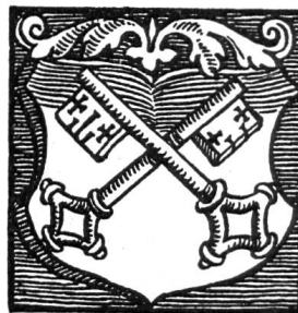
Fig. 2. Ardon (Chronique de Stumpf)

Le plus ancien témoignage des armes d'Ardon qui nous soit parvenu (fig. 2), se trouve dans la célèbre Chronique de Johann Stumpf, de Zurich, parue en