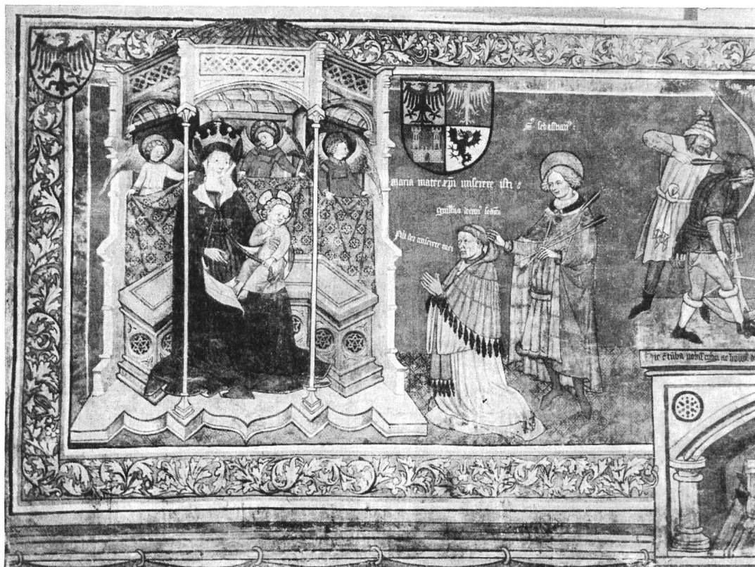
Fig. 4. Fresque du tombeau de Guillaume de Rarogne † 1451

donne une variante plus complète de ces armes, dans un écu de grand format, placé au-dessus de Guillaume agenouillé en donateur, présenté par saint Sébastien, dont il avait rapporté des reliques de Rome. L'écu est écartelé : au 1 : d'or à l'aigle de sable, becquée de gueules (Rarogne); au 2 : de gueules à l'aigle d'or (Rarogne-Anniviers; Annina, mère de l'évêque); au 3 : d'azur au château d'or (d'Ornavasso de Castello; Agnès, dernière du nom, apporte aux Rarogne une seigneurie à Naters); au 4 : d'argent au dragon de sable, crêté et langué de gueules (Naters).