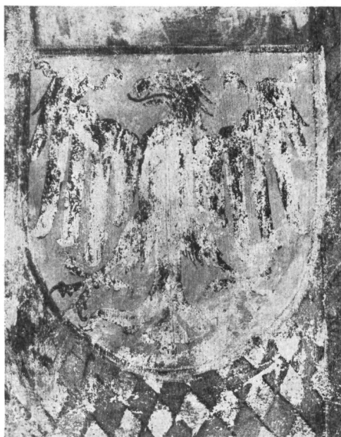
Fig. 2. Guillaume de Rarogne, doyen de Sion.