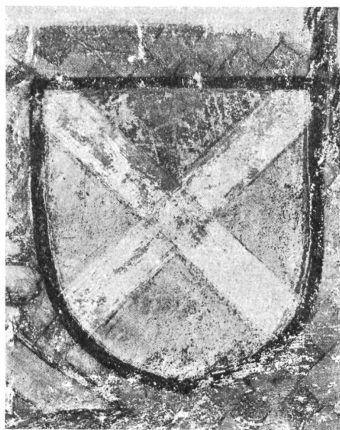
Fig. 3. Anselme de Faussonay, doyen de Valère.

Valais en 1437. C'est ainsi que l'on peut très sûrement dater cette fresque entre 1434 et 1437 14 .