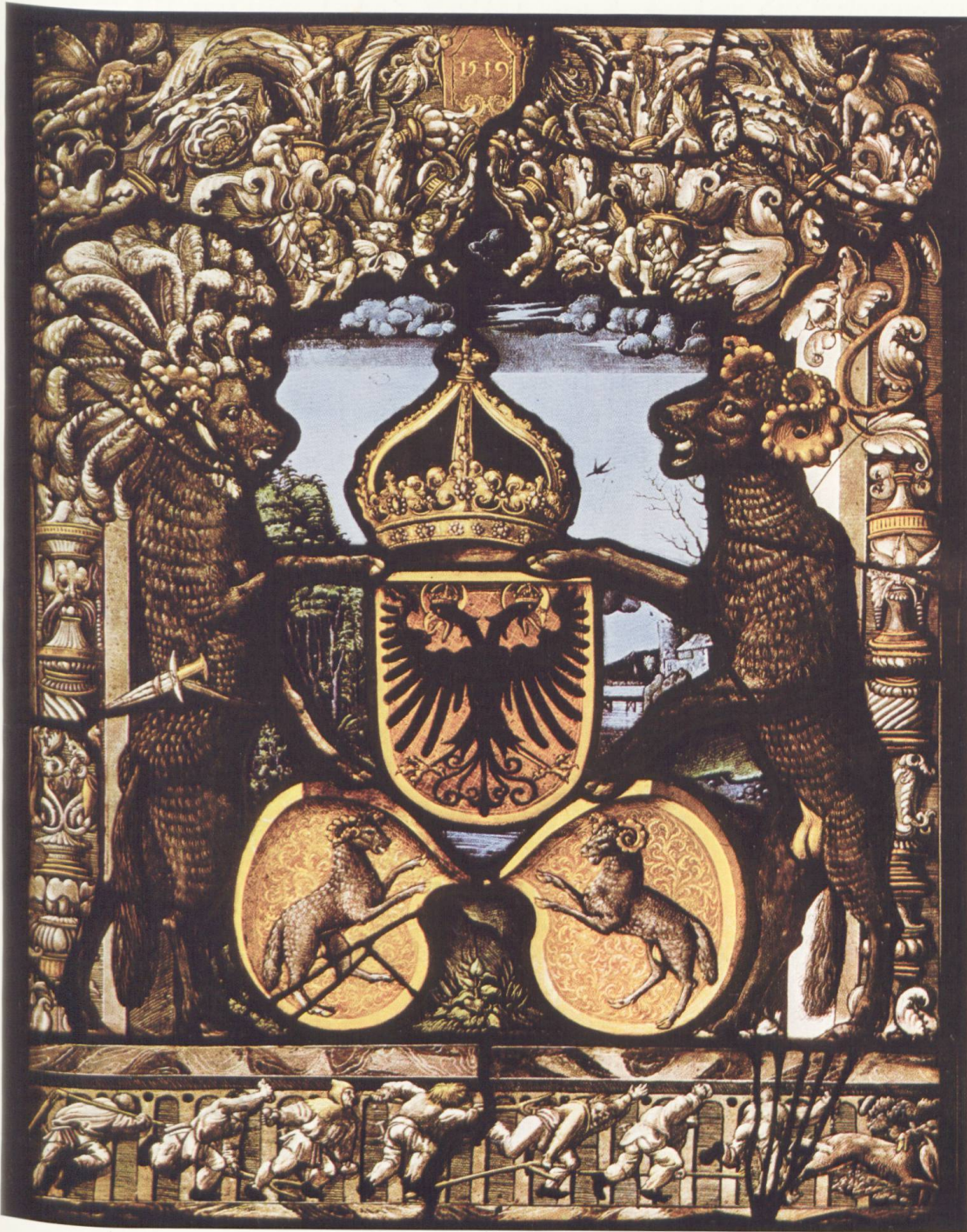
Standesscheibe von Schaffhausen von Anthony Glaser aus dem Jahre 1519 im Rathaus zu Basel (Nr. 7)