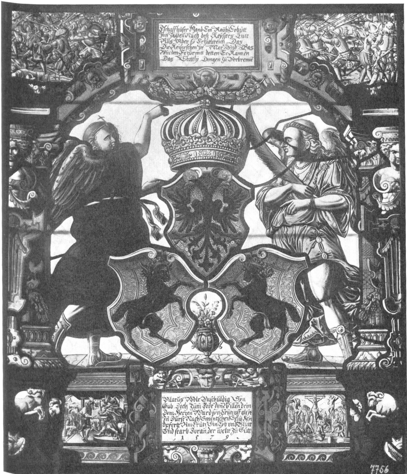
Schaffhauser Standesscheibe in das Kloster Wettingen (Nr. 244) 1579