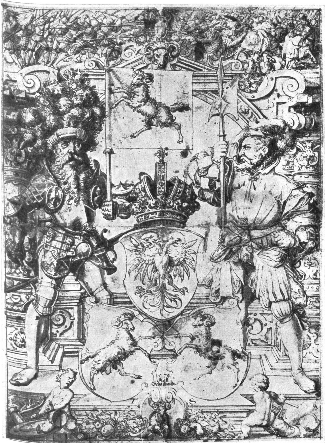
Riss von Tobias Stimmer 1579 für eine Schaffhauser Standesscheibe für Wilhelm Tugginer gen. Frölich von Solothurn (? , vgl. Nr. 241)