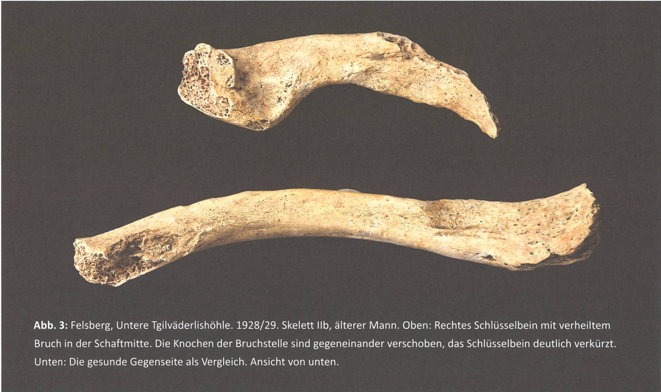
Abb. 3: Felsberg, Untere Tgilväd-erlishöhle. 1928/29. Skelett IIb, älterer Mann. Oben: Rechtes Schlüsselbein mit verheiltem Bruch in der Schaftmitte. Die Knochen der Bruchstelle sind gegeneinander verschoben, das Schlüsselbein deutlich verkürzt. Unten: Die gesunde Gegenseite als Vergleich. Ansicht von unten.