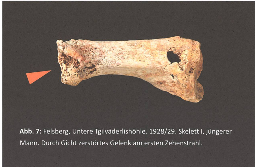
Abb. 7: Felsberg, Untere Tgilvädärlishöhle. 1928/29. Skelett I, jüngerer Mann. Durch Gicht zerstörtes Gelenk am ersten Zehenstrahl.

Vom Zahnverlust sind vor allem die Backenzähne betroffen.