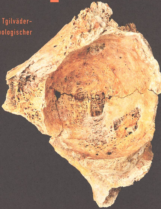
Abb. 5: Felsberg, Untere Tgilväd- erlishöhle. 1928/29. Skelett IIIb, älteres Individuum. Linke Beckenpfanne mit starken, durch Arthrose her- vorgeführten Gelenkveränderungen.