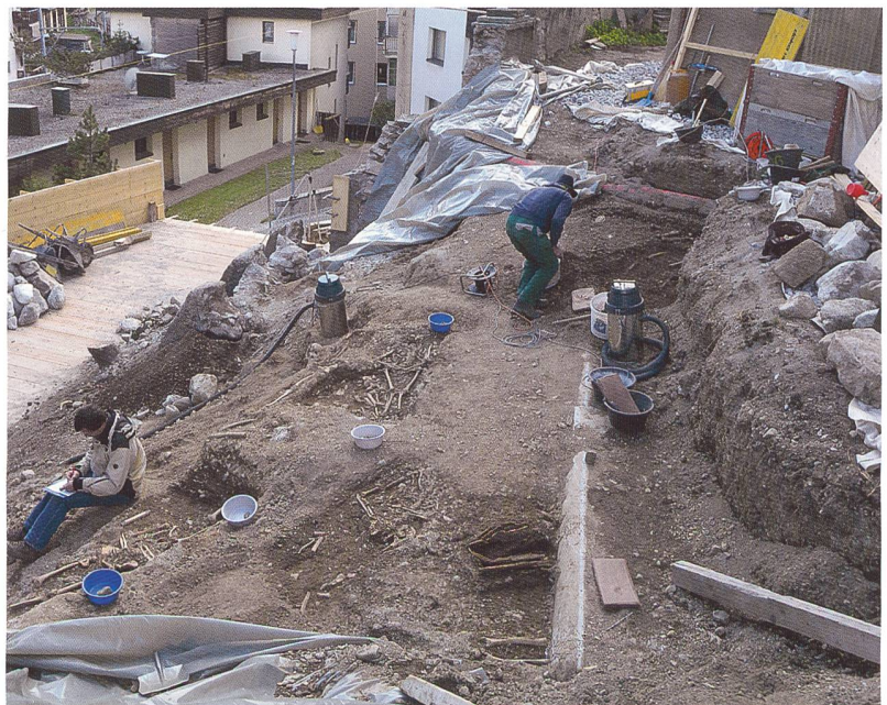
Abb.5: Davos, evangelisch-reformierte Kirche St. Johann. Freigelegte Bestattungen des Spätmittelalters und der Neuzeit im östlichen Friedhofareal. Blick gegen Süden.

Freigelegte Bestattungen des Spätmittelalters und der Neuzeit im östlichen Friedhofareal. Blick gegen Süden.