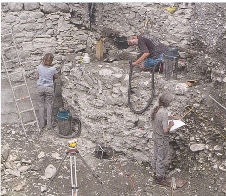
Abb. 2: Chur, Steinbruchstrasse Nr. 4. Untersuchung der Stadtmauer des 13. Jahrhunderts (links) und des Schmiedeturmes aus dem 16. Jahrhundert (rechts). Blick gegen Westen.

Bauzeugen kein Thema. Auf eigene Initiative liess sie die Baupläne unter Einbezug des Turmfundamentes anpassen. Dank ihrem Engagement ist das Mauerrund erhalten geblieben und kann heute im Kellerraum und von oben, durch eine begehbare Glasplatte, besichtigt werden. Riedis wünschten auch, dass die Stadtmauer, die im 13. Jahrhundert errichtet und im 16. Jahrhundert