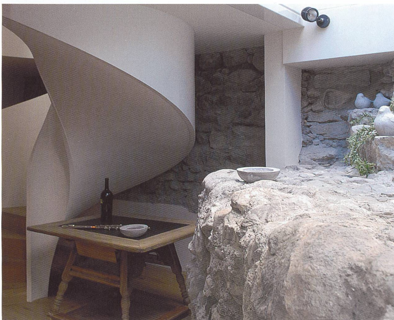
Abb. 4: Chur, Steinbruchstrasse Nr. 4. Im Untergeschoss sind das Fundament des Schmiedeturms und die Stadtmauer sichtbar in den Neubau integriert.

Verkohlte Balken und Getreidekonzentrationen zeugen von mehreren Brandereignissen. Irgendwann war der riesige Bau nicht mehr zu unterhalten und zerfiel. Teile des Gebäudeinneren wurden in der Folge als Friedhof benutzt, die Aussenmauern erhielten die Funktion einer Umfassungsmauer. Die Nähe zur Kirche St. Andreas, der heutigen evangelisch-reformierten Kirche, lässt annehmen, dass bereits zur Zeit der Hofanlage an dieser Stelle ein Gotteshaus stand. Viele Fragen, vor allem zur detaillierten Bauabfolge und zu den exakten Datierungen der einzelnen Bauphasen dieser Anlage, sind noch offen. Antworten darauf hoffen wir in der zweiten Ausgrabungsetappe im nächsten Jahr zu erhalten.