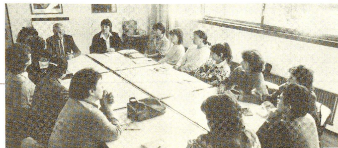
Giornata di aggiornamento per una quindicina di collaboratrici sanitarie Croce Rossa riunite a Locarno.

Nei programmi della Croce Rossa è previsto, per il 1988, un ulteriore incremento dei corsi di cure di base, al fine di poter raggiungere un numero sempre più elevato di collaboratrici sanitarie disposte sia a collaborare in modo benevolo o retribuito con i professionisti della salute, sia a intervenire nell'eventualità di catastrofi o di guerra.