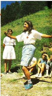
Una delle due sorelle curde esegue una danza tradizionale, un chiaro messaggio di gioia, un'espressione della realtà di un'esistenza difficile.

La preparazione di formaggio, in un alpe nella vicinanza del campo, ha suscitato curiosità di grandi e piccoli.