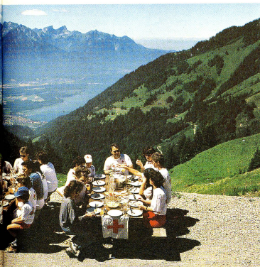
Ore spensierate all'insegna della fratellanza.