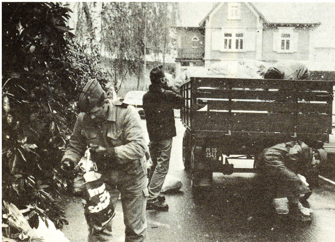
Corrisponde a circa 300 mila chili la quantità degli indumenti usati raccolti dalla sezione di Aarau di CRS.

Il sistema «Ericare» permette, premendo un pulsante al polso, di mettersi in contatto, in caso di caduta o dolore, con una centrale in funzione 24 ore su 24, e che allarma chi di dovere. La sezione Aarau della CRS ha a disposizione 15 di questi apparecchietti, che vengono dati in affitto. Con notevole successo vengono dati in affitto anche letti per ammalati, di proprietà della sezione, per pazienti a domicilio. Molto valido, inoltre, è il servizio di visite a domicilio della CRS, col quale volontari dedicano regolarmente alcune ore a queste persone sole con le quali discorrono, passeggiano, vanno a far spese, o alle quali fanno della lettura o semplicemente le stanno a sentire.