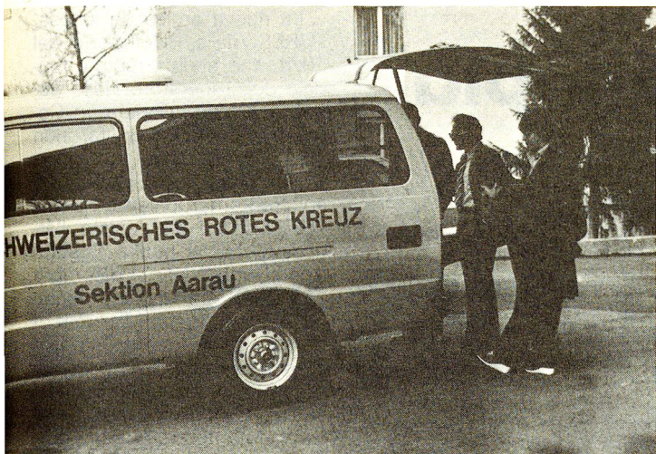
Ambulanza della sezione di Aarau di CRS, veicolo destinato al trasporto di pazienti non gravi, comunque costretti alla posizione coricata.