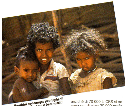
Bambini nel campo profughi di Wad Sherife: sani e ben nutriti possono oggi guardare con nuova fiducia al futuro.