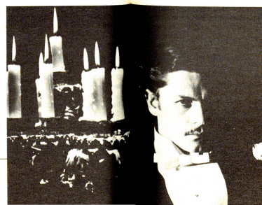
Per secoli e secoli l'uomo di scienza ha cercato di capire il preciso ruolo del sangue alla luce delle candele.

Michel Servet, medico spagnolo che, perseguito dall'inquisizione, riparò a Ginevra (1509-1553), scoprì che la circolazione polmonare permette al sangue venoso di purificarsi e di ossigenarsi nei polmoni.