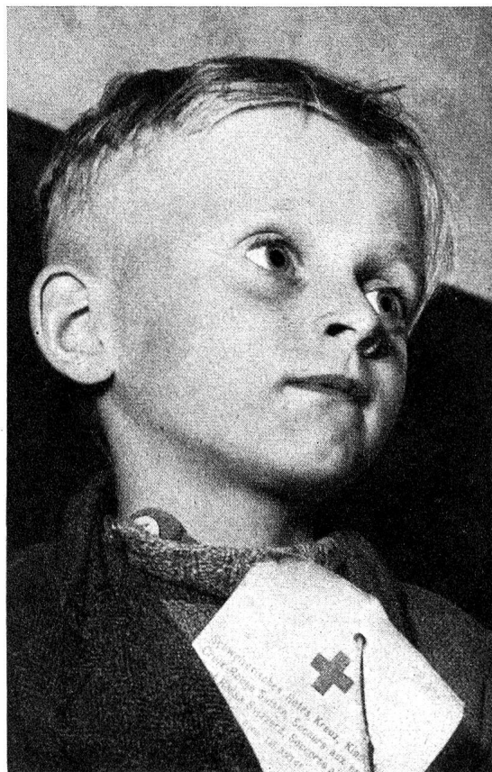
L'avenir est sombre pour ce petit Berlinois. Mais il le regarde avec un courage calme et confiant.

Bâle nous accueille au petit jour et nos enfants pâles et fatigués ouvrent des yeux émerveillés sur un monde qu'ils avaient oublié depuis longtemps. Il était temps! En effet, depuis que, chaque semaine, un train ramène en Suisse des enfants victimes de la guerre, pour la première fois au cours de toutes ces années, la ration de secours, gardée pour les cas de dernière urgence, a dû être tirée des caisses et distribuée!