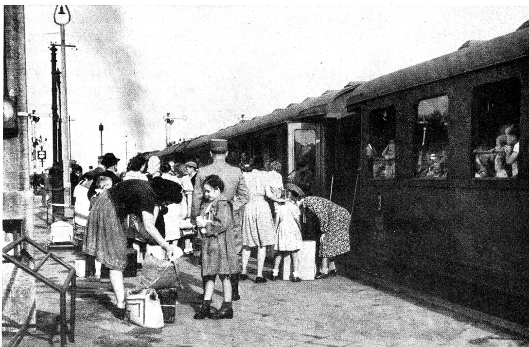
Notre convoi en gare de Berlin-Grunewald.