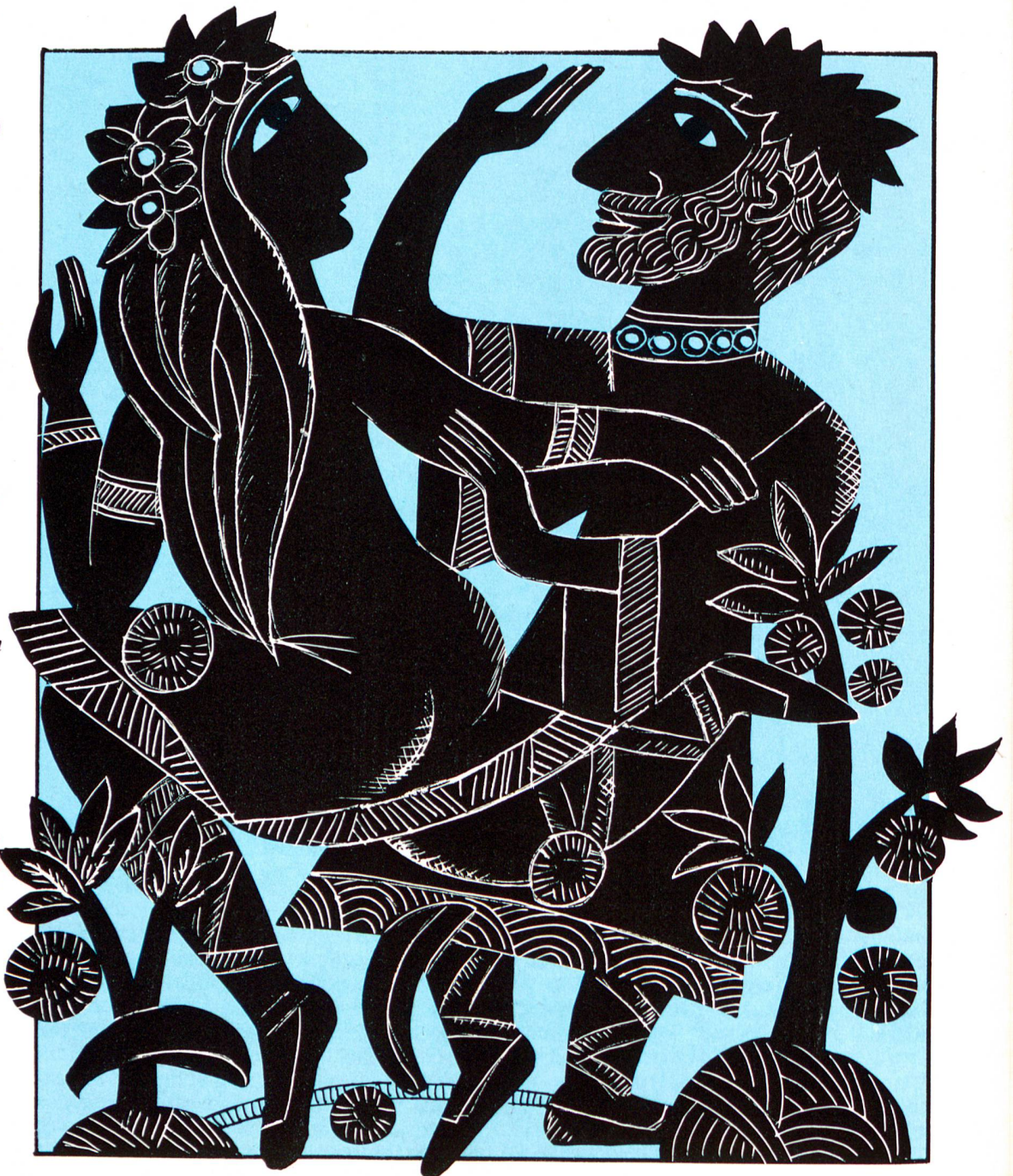
ILLUSTRATION: HEINZ STIEGER

ACTIO HUMANA: Gibt es für Sie eine Idealbeziehung? EDIT SCHLAFFER: In unserem letzten Buch wollten wir ursprünglich gute Bezie-