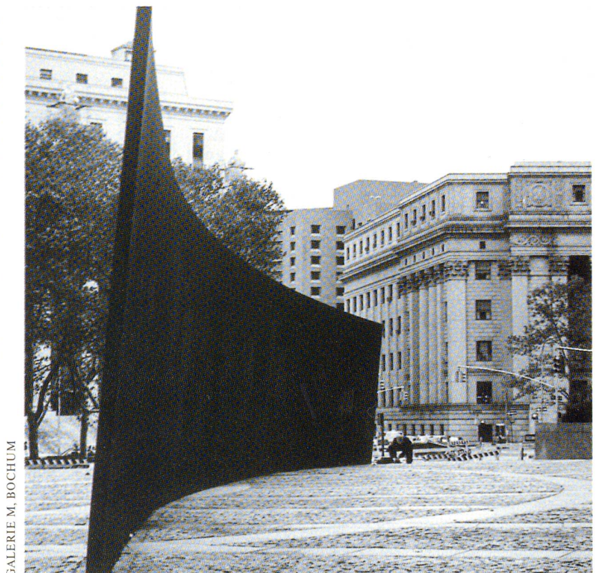
GALERIE M. BOCHUM

Stiller, aber eindringlicher Kommentar über die Umwelt. Der (inzwischen von der US-Regie- rung beseitigte) TILTED ARC von Serra in New York.