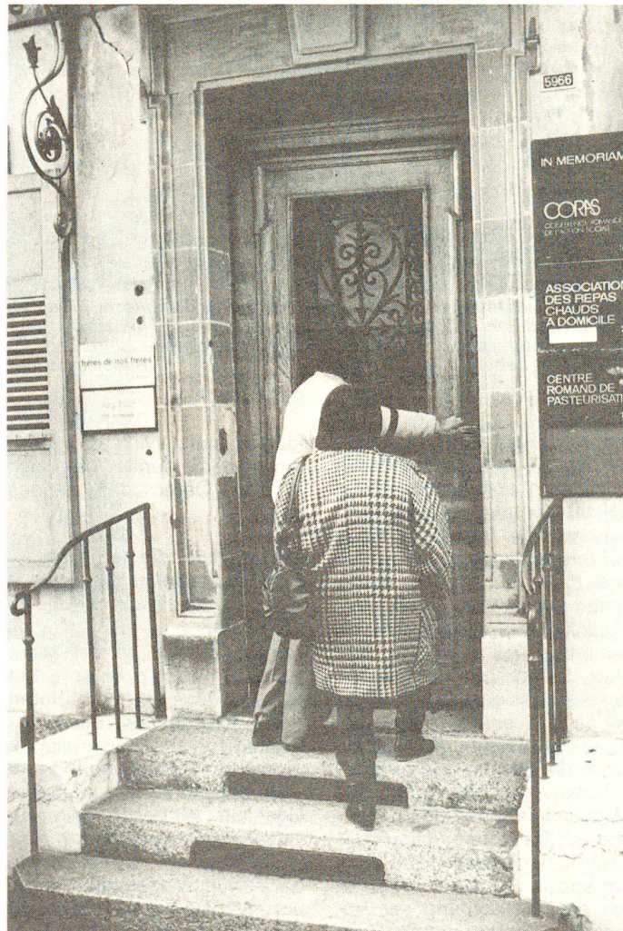
Das Haus an der Avenue de Rumine Nr. 2 in Lausanne: ein Reisebüro besonderer Art.

Die einen halten die Ungewissheit nicht mehr länger aus, die anderen wurden abgewiesen – viele ehemalige Asylbewerber verlassen die Schweiz und ihr verlorenes Paradies, um in ihre Heimat zurückzukehren oder in einem anderen Land Asyl zu suchen. Starthilfe leistet ihnen dabei ein Reisebüro ganz besonderer Art: eine Beratungsstelle des Schweizerischen Roten Kreuzes.