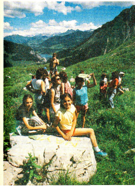
Unterwegs zu den Rochers-de-Naye.