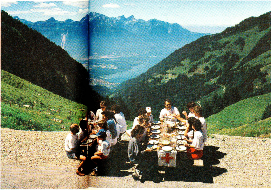
Ungezwohene Atmosphäre während des Mittagessens vor der Refex-Hütte am Fusse der Rochers-de-Naye.