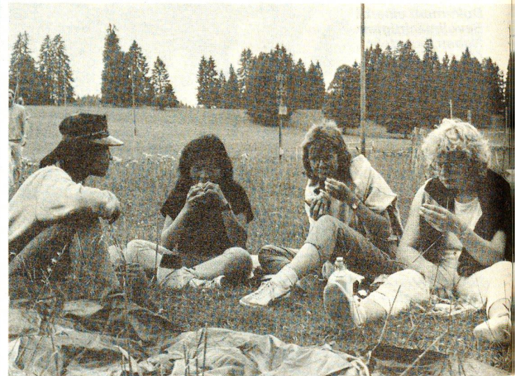
Gemeinsam müde und hungrig: auch das eine integrierende Erfahrung.

Was vorauszusehen war, trat auch ein: Die Zeit verging viel zu schnell. So war er dann plötzlich da, der Abschied. Doch es war ein anderes Händedrückchen als beim ersten Kennenlernen. Für einige der Schweizer Lagerteilnehmer war es das erstemal, dass sie bewusst auf einen Menschen eines fremden Kulturkreises zugegangen waren, ihn kennenlernen durften. Manches Vorurteil, konnte abgebaut werden. Flüchtlinge durften die Erfahrung machen, dass sie als Mitmenschen akzeptiert wurden, dass sie sich nicht minderwertig vorkommen mussten. Die Erfahrung,