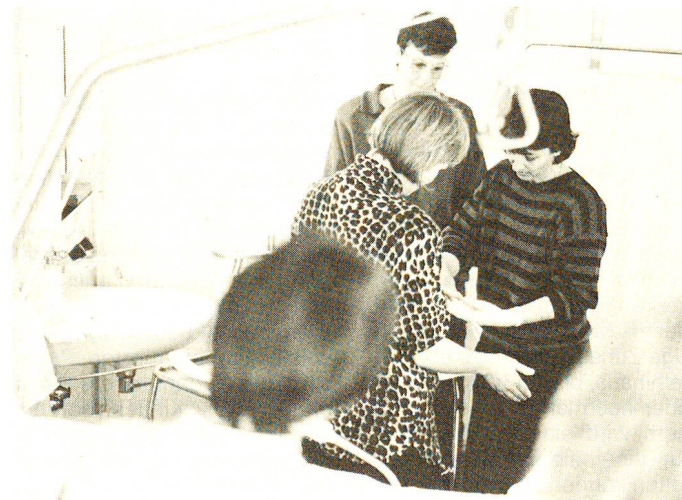
Es ist eine knifflige Sache, sterile Handschuhe anzuziehen.

Auf der ganzen Linie haben diese engagierten Spätberufenen einen besseren Zugang zu ihrem Beruf und vor allem auch zu den betagten Patienten als ganz junges, unverfahrenes Pflegepersonal. Sie sind schon vom Alter her vertrauter mit deren Sorgen und Äng-