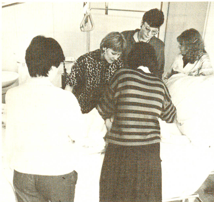
Die Schülerinnen üben, wie man dem Patienten einen Dauerkatheter einsetzt – eine Aufgabe, mit der die Krankenpflegerinnen vor allem in Heimen konfrontiert werden.

Die Ausbildung in praktischer Krankenpflege der «Städtischen Krankenpflegeschule Engeried-Bern» für Spätberufene teilt sich auf in drei Phasen; jede Phase beginnt mit einem Theoriekurs, welchem anschliessend die Praktika in einem Pflegeheim oder Akutspital im Umkreis von ca. 40 km von Bern folgen. Am heutigen Vormittag ist Theorieunterricht. Zwei Grup-