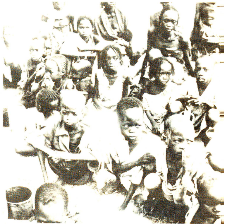
Tschad In der Präfektur Biltine soll ein angemessener Basisgesundheitsdienst aufgebaut werden. Das SRK engagiert sich langfristig und setzt eine aktive Beteiligung der einheimischen Kräfte voraus.

Eine vom SRK im April 1985 durchgeführte Evaluation in den Hungergebieten im Tschad hat die Vermutung bestätigt, dass die Aktionen unserer Dachorganisation Fehler und Mängel in Planung, Konzeption und Durchführung aufweisen. Das SRK hat in der Folge vermehrt eigene Programme durchgeführt.