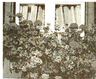
Balkon im Sommer.