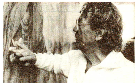
29 Panta Rhei – Alles fliesst Künstlerporträt Hans Erni