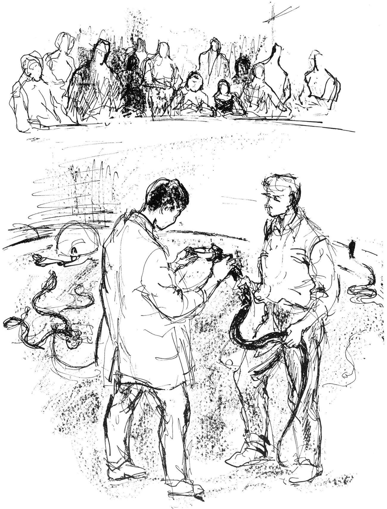
Um eine der mannigfaltigen Arten von Tätigkeiten im Dienste der Volksgesundheit zu zeigen, stellte das Thailändische Rote Kreuz der Ausstellungsorganisation 500 Königskobras, Rajas und Russelvipern, die giftigsten Schlangen seines Landes, zur Verfügung. Die Besucher der Ausstellung konnten zu bestimmten Zeiten den von thailändischen Fachleuten vorgenommenen Giftentnahmen beiwohnen; das Gift dient der Herstellung von Schlangenserum. Zeichnungen Margarete Lipps, Zürich.