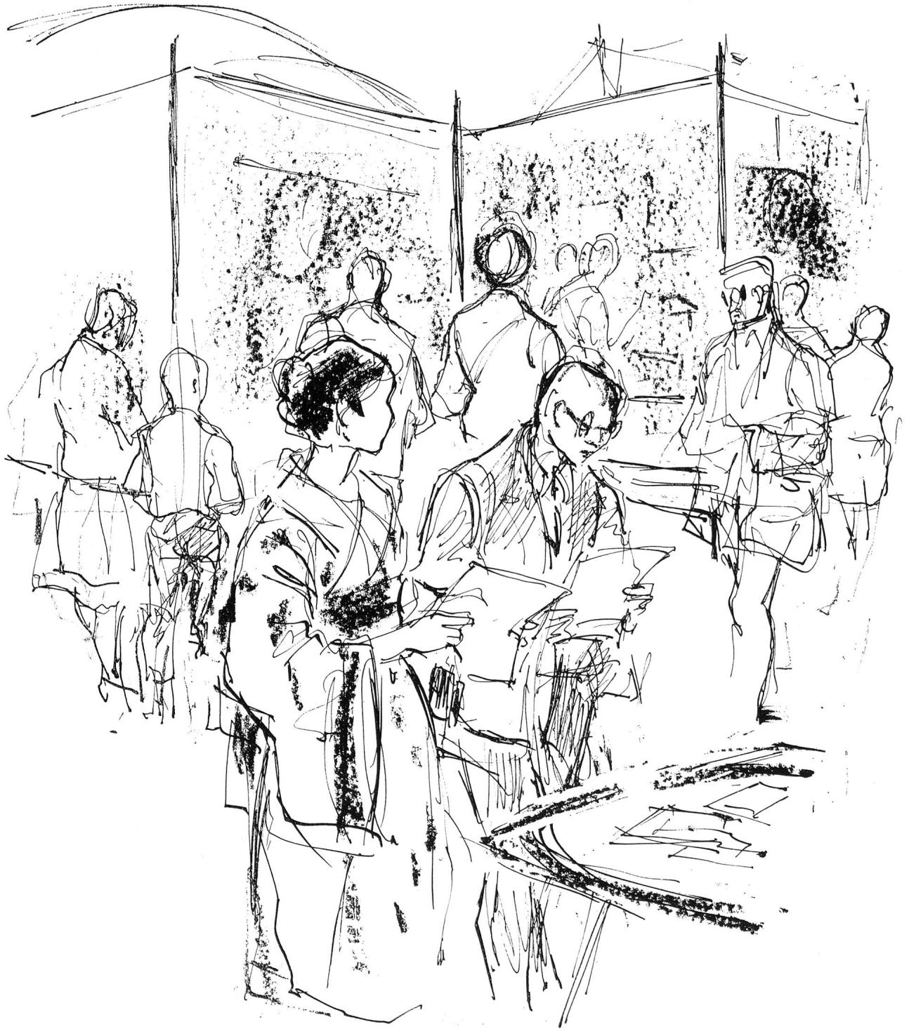
Ueber hunderttausend Personen, darunter Angehörige der verschiedensten Nationen, haben die Rotkreuz-Ausstellung im Palais des Expositions in Genf besucht.

aller Bemühungen um die Ausdehnung der ersten Genfer Konvention auf den Seekrieg. Doch erst 1899, 33 Jahre später, wurde ein schon 1868 gutgeheissenes Projekt als «Haager Konvention über die Anwendung der Grundsätze der Genfer Konvention von 1864 auf die Verhältnisse des Seekriegs» ratifiziert.