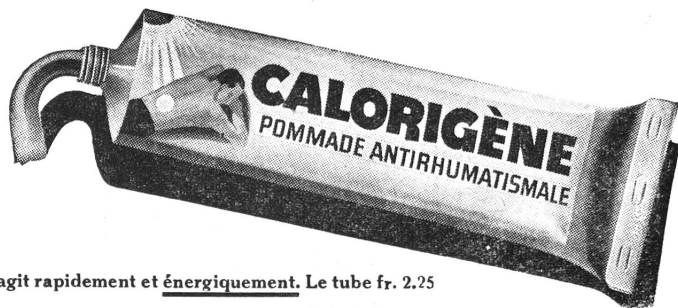
agit rapidement et énergiquement. Le tube fr. 2.25

Basel, Klein-Basel. S.-V. Mi., 27. Okt., 20.00 im Rest. «Greifen» (Greifengasse): Lichtbildervortrag von E. Th. Spiess über: Erinnerungen an eine Sizilienreise. Mitglieder mit ihren Angehörigen sind freundlich eingeladen. Ende Oktober werden die noch ausstehenden