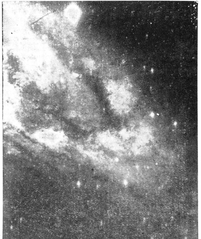
Detail-Aufnahme des Andromedanebels mit dem 100 Zoller (260 cm Öffnung). Der Andromedanebel ist schon im Feldstecher als lichte Wolke zu beobachten.

Genauere Untersuchungen haben ergeben, dass die Sonnen in dieser Welteninsel die gleichen Leuchtkräfte besitzen wie unsere Sterne. Aber nicht nur das: es finden sich auch Sternhaufen, Sternwolken und