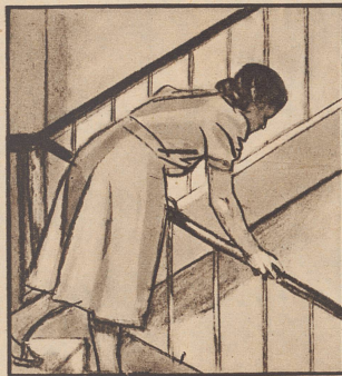
„Ist denn Ihrer auch noch nicht daheim? Bei dem schlechten Wetter holen sie sich gleich den Husten!“