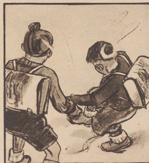
es wird oft eine Stunde daraus. Man „schleift“ oder tappi in die Pfützen. Und wenn's gar Schnee gibt!