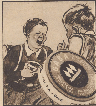
„Keine Angst, ich gebe dem Buben immer Gaba auf den Schulweg mit. Gaba schützt vor Husten und Heiserkeit.“