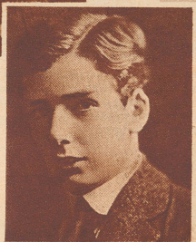
Anthony Eden als Etonstudent im Alter von 13 Jahren.