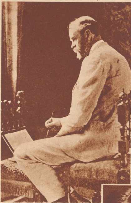
Sir William Eden, bekannter Sportsmann, Dichter, Mäzen, Landwirt und Maler, der Vater Anthony Edens, des gegenwärtigen britischen Außenministers.