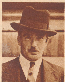
Anthony Eden von heute, der jüngste britische Außenminister innerhalb der letzten 84 Jahre.