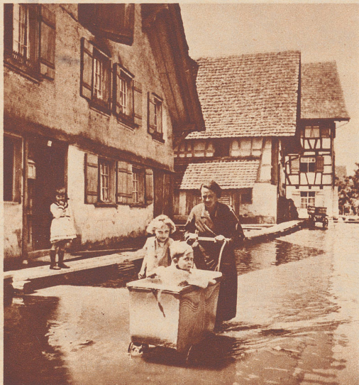
Spazierfahrt mit dem Kinderwagen durch die Hauptstraße von Ermatingen.