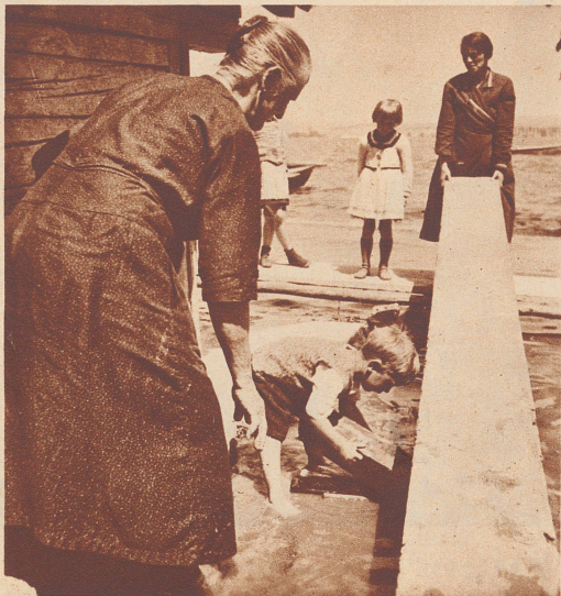
Notstegebau in einer Straße von Ermatingen.