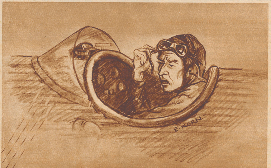
Während des Fluges hat der Motor ohne erklärbaren Grund plötzlich zu arbeiten aufgehört. Der Pilot aber vermutet, die Pann sei durch fremde Strahlungen hervorgerufen, die die Zündvorrichtung außer Funktion gesetzt hätten. Er schickt sich an, im Gleitflug niederzugehen. Bei der nachfolgenden gründlichen Untersuchung stellt sich heraus, daß eine ganz gewöhnliche Verruung der Kerzen den Streik verursacht hatte.