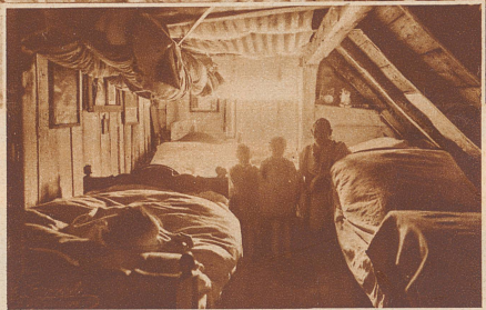
Bei den Heimwebern im Frankenwald. Schlafräum ist die Boden-kammer. In jedem Bett drei, vier Menschen. Durch das morsche Dach dringt Wind, Schnee und Regen herein. - In dieser Gegend schrieb ein Schulkind zu dem Aufsatzthema «Mein größter Wunsch»: «Wenn ich mir wünschen könnte, würde ich mir mal ein Bett kaufen und jede Nacht ganz allein darin schlafen»

stellern betrachten, er wollte das Bild des «Deutschland von unten» erkennen und festhalten. So wanderte und reiste er im Elendssommer 1930 kreuz und quer durch viele Teile Deutschlands; überall dort, wo gearbeitet und gehungert, gestempelt und gehungert wurde. Er war bei den Handwebern, Holzflößern