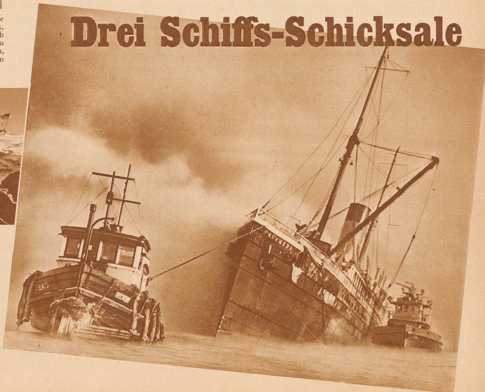
Bild rechts: Der amerikanische Frachtdampfer «Alameda», der seit 1908 zwischen Seattle und Alaska kursierte, geriet im Heimathafen Seattle in Brand. Löscharbeiten waren zwecklos und so wurde die «Alameda» in die offene See hinausgeschleppt und dort ihrem Schicksal überlassen. Der Wert des Schiffes wird auf 5 Millionen Schweizerfranken geschätzt