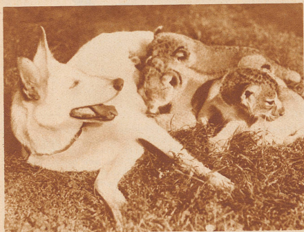
Weißer deutsche Schäferhündin als Amme von drei jungen Löwen