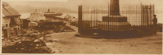
Die Meridiansäule bei Hammerfest

er sich auf diese Weise warm zu halten. Unerträglich trüb und dumpfig erscheint dem Kulturmenschen dieses Wohnen! In allen Hütten findet sich große Unsauberkeit, deren gesundheitsschädliche Wirkungen freilich durch den häufigen Aufenthalt in freier Luft ausge-