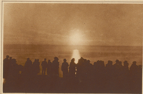
Mitternachtssonne, 12 Uhr nachts, am Nordkap

glichen wird. Jedes Lappenlager umfaßt mehrere Familien, die im Winter festere Erdhütten, im Sommer spitze, leinene Zelte bewohnen. Ein einziges Lager zählt oft bis zu 4000 Rentieren. Was dem Aelpler Geiß und Kuh sind, das ist dem Lappen das Rentier. Mit diesem deckt er seine meisten Bedürfnisse. Vielleicht hat er das ursprünglich wilde Tier des hohen Nordens erst gezähmt, und es zum echten, fügsamen Haustier gemacht. Geweih, Fleisch, Zähne, Haut, Pelz, Milch, Speck und Blut des Tieres, ja Knochen und Sehnen desselben braucht er zur Nahrung, Kleidung und Gerät. Die Rentiermilch ist dicklich und fett wie Rahm, und ergibt auch Käse für den Winterbedarf.