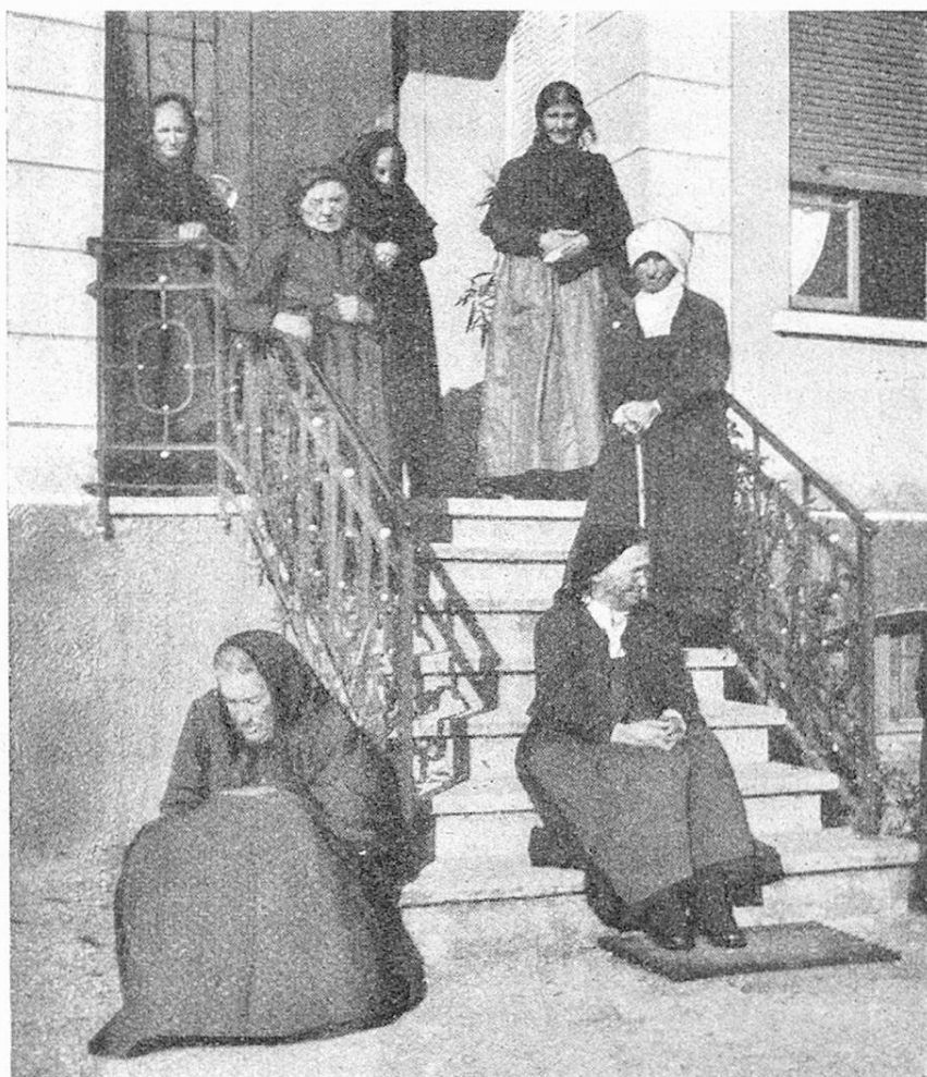
Vecchie donne all'uscio del ricovero Gordola e Valle Verzasca. Alte Frauen vor dem Altersasyl Gordola-Val Verzasca.

Per esempio, l'assemblea dei delegati della fondazione „Per la vecchiaia“ del 5 Novembre 1919, come prima donazione decise, con lieta unanimità, una sovvenzione di Fr. 20,000 da prelevarsi dalla cassa centrale dell' appena costituita Fondazione, da versare ai vecchi cantoni per l'erezione di case per la vecchiaia.