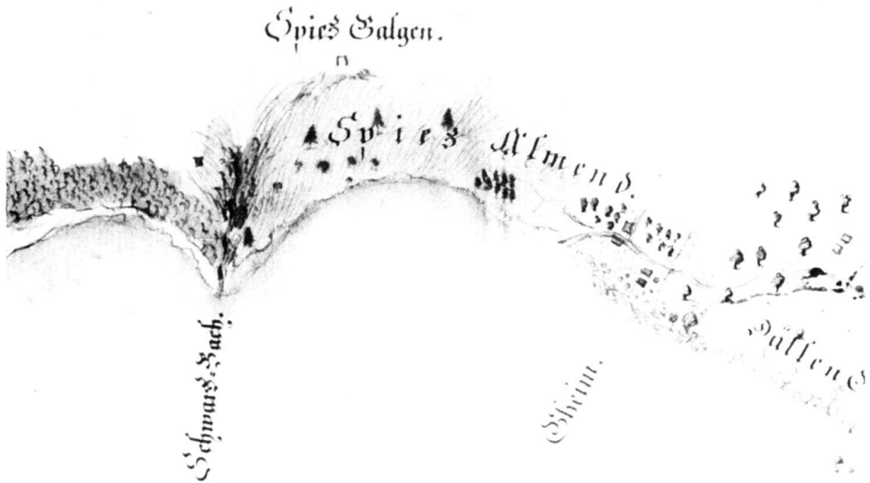
Ausschnitt aus der Thunerseekarte von Johann Jakob Brenner, 1771, mit dem Uferstreifen bei Spiez und dem ehemaligen Standort des «Spiez Galgen». (Staatsarchiv des Kantons Bern AA V, Brienzer-Thunersee Nr. 1).