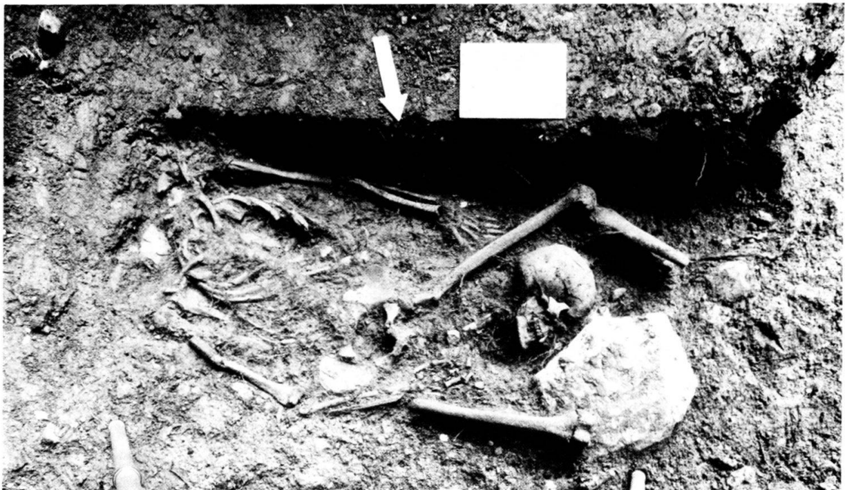
Der Skelettfund von Spiez aus dem Jahr 1984 mit dem zwischen den Beinen liegenden Schädel. Aufgrund der Arm- und Beinlage kann vermutet werden, dass der Leichnam ohne grosse Sorgfalt in die Grube gelegt wurde, eventuell liess man ihn sogar hineinfallen. Hingegen erlaubt der fest geschlossene Mund keinen Hinweis auf die beim Tode innegehabte Stellung (zusammengebissene Zähne!). (Foto ADB).