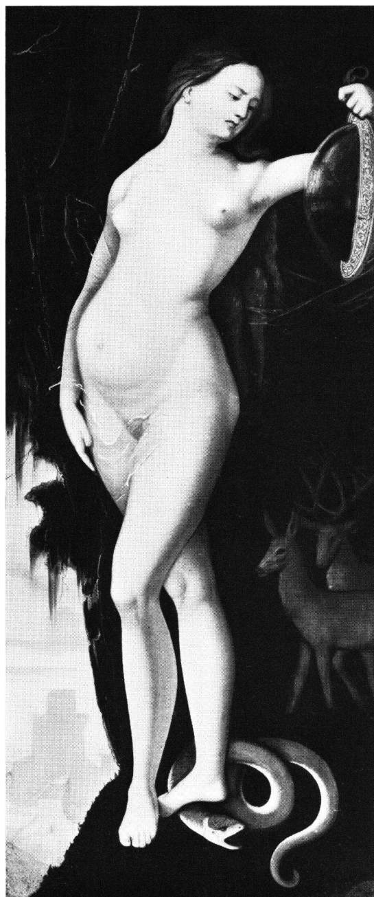
Fig. 2 Hans Baldung, La Prudence , 1529, Munich, Alte Pinakothek