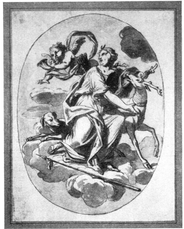
Abb. 3. Helmhack, Abraham. Diana in Wolken. Getuschte Federzeichnung. Basel, Kupferstichkabinett