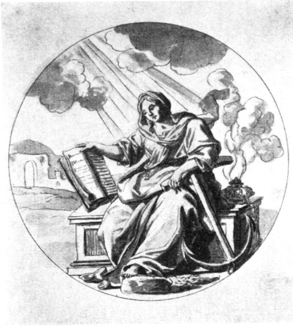
Abb. 2. Helmhack, Abraham. Allegorie der Hoffnung. Getuschte Federzeichnung. Basel, Kupferstichkabinett