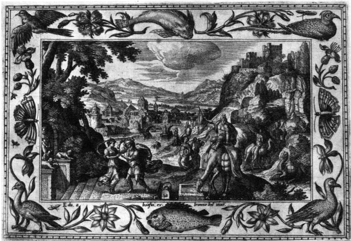
Abb. 1. Stich von Adriaen Collaert nach Zeichnung von Hans Bol . Elieser und Rebekka. Vergl. Anz. 1932, S. 312, Abb. 1.