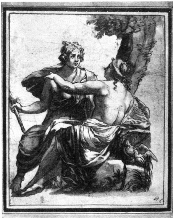
Abb. 4. Helmhack, Abraham. Kopie nach Simon Vouet. Venus und Adonis. Getuschte Federzeichnung Basel, Kupferstichkabinett