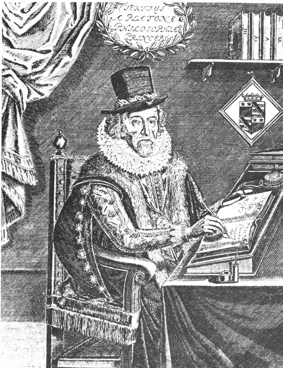
Sir Francis Bacon (1561–1626), Wissenschaftler und Staatsmann, Patriarch und Hexenjäger. Mit 23 Jahren Parlamentsabgeord- neter, nach steiler Karriere 1618 als Lordkanzler wegen passiver Bestechung gestürzt.

Interessant ist für uns, wie sehr Bacon — der zentrale Ideologe der modernen Naturwissenschaft in ihren Anfängen — Vorstellungen aus der Politik übernommen hatte, um sie auf seine