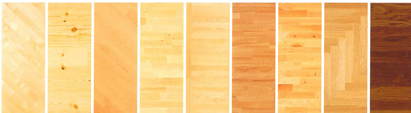
Beliebte Parkettarten in der Schweiz: Ahorn, Kiefer, Buche, Birke, Esche, Kirschbaum, Erle, Eiche, Nussbaum.