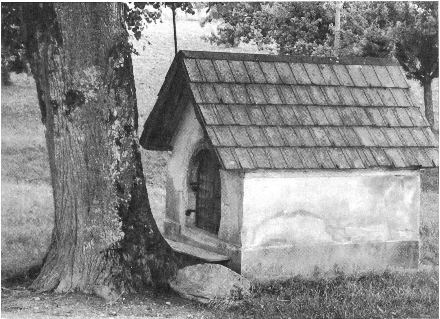
Das Siebenschläfer-Chäppali vor der Restauration.

mit einer 200jährigen Goldmünze bezahlte, staunten die Bewohner und eilten zur Höhle, wo sie die Märtyrer wohlauf fanden.