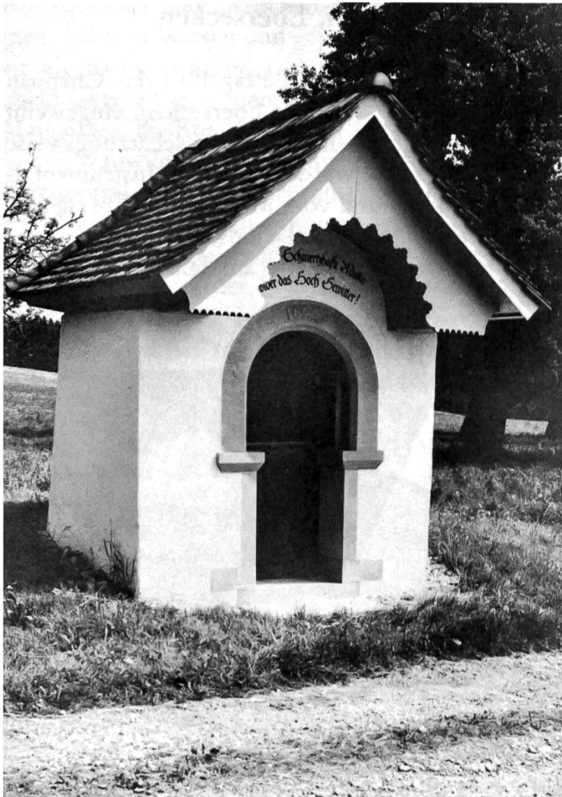
Sein Aussehen heute. Die Schäden wurden behoben und unschickliche Zutaten entfernt.

Wie eine Jahrzahl verrät, wurde das gediegen restaurierte Chäppali anno 1822 erbaut. Im Gegensatz zum Siebenschläfer-Chäppali in Seewagen ist jenes auf dem Esch nicht einem Heiligen allein geweiht. Hingegen ist es eindeutig, dass die Muttergottes-Verehrung im Vordergrund steht. Dies bezeugen ein aufgemalter Spruch über dem Eingangsbogen wie das Inventar. «Zu Ehre der Schmertzhafte Mutter und wider das Hoch Gewitter!» (so die Aufschrift) erklären ferner, dass mit dem Chäppali auch ein Schutzanliegen gegen Unwetter verbunden war. Über die weitere Geschichte ist nichts bekannt, ausser dass es privat der Familie Häfliger nebenan gehört und ehemals auch auf private Initiative entstanden ist. Architektonisch