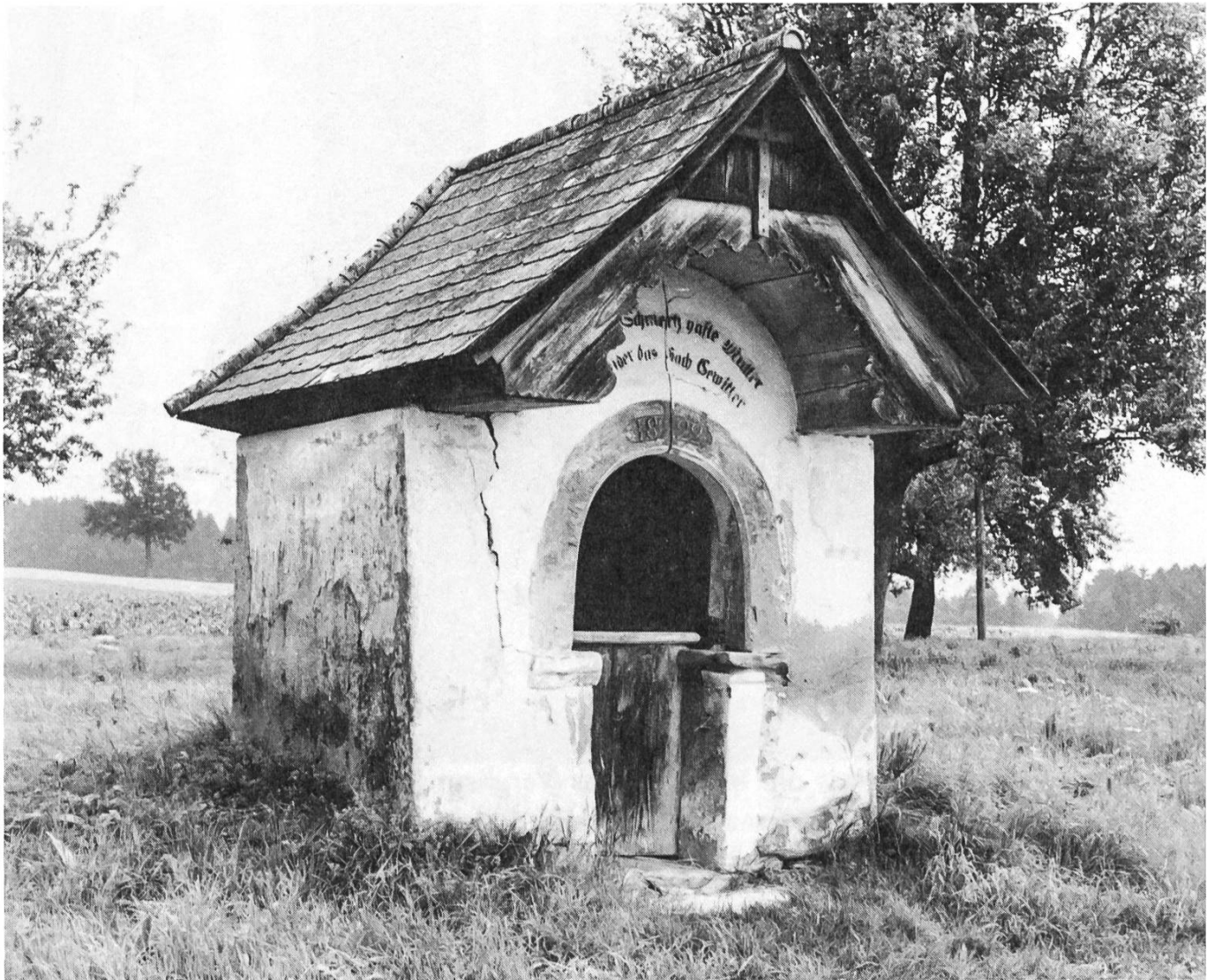
So angeschlagen sah das Chäppali Warlosen vor seiner Restaurierung aus.

Ebenfalls bei herrlichstem Wetter konnte am Bettag 1983 das Chäppali Warlosen auf dem Chäppalihof, Esch, Gemeinde Ebersecken, eingeweiht werden. Der damit verbundene Feldgottesdienst war von schätzungsweise 400 Personen besucht. Der Gottesdienst wurde von einem Instrumentalquartett, vom Kirchenchor Altishofen und vom Männerchor Ebersecken gesanglich-musikalisch mitgestaltet. Die Gottesdienstworte von Pfarrer Pius Sieber und Mitgliedern des Pfarreirates waren auf den Bettag und den Einweihungsakt abgestimmt.