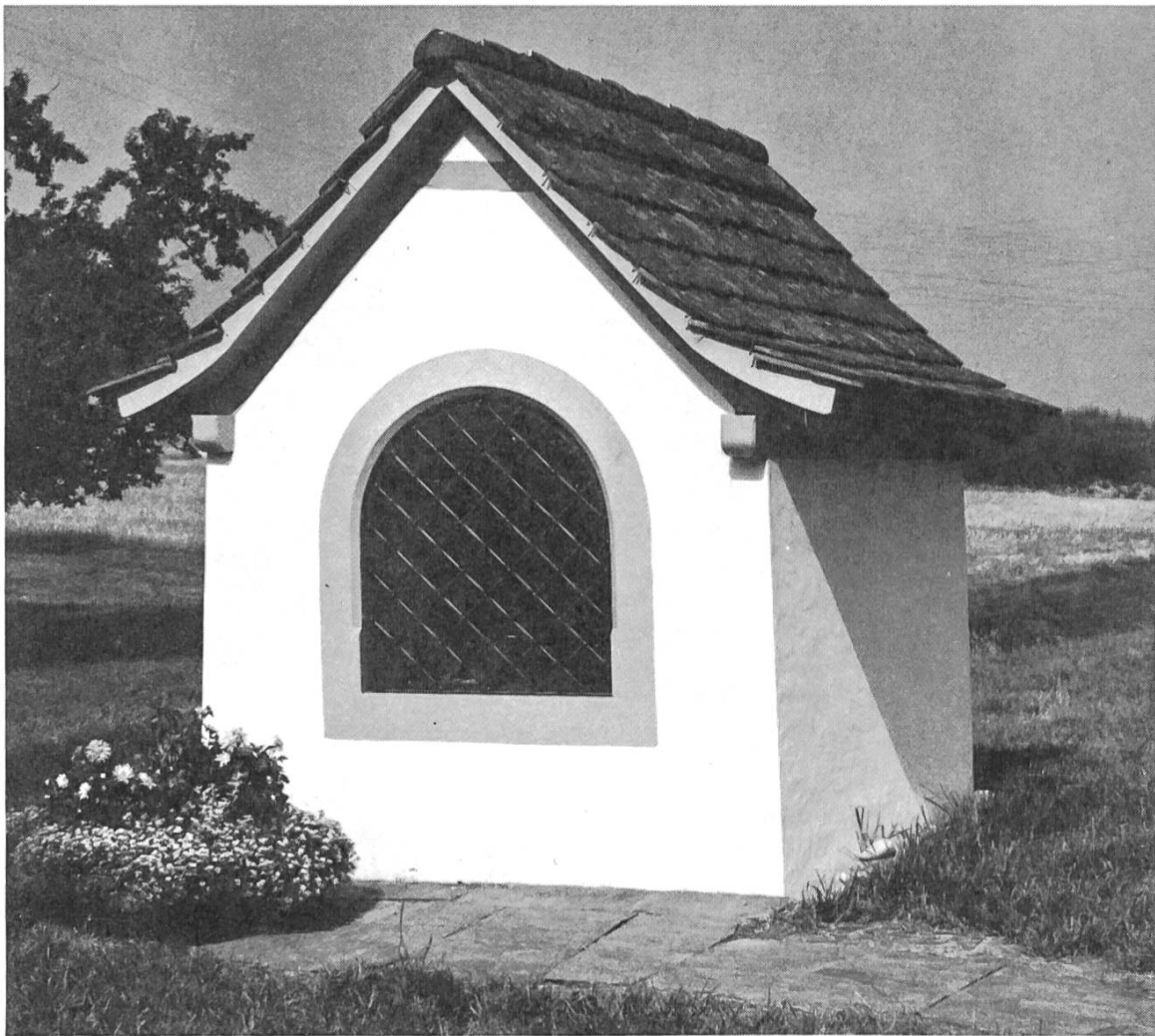
Das renovierte schlichtanmutige Siebenschläfer-Chäppali in Seewagen.