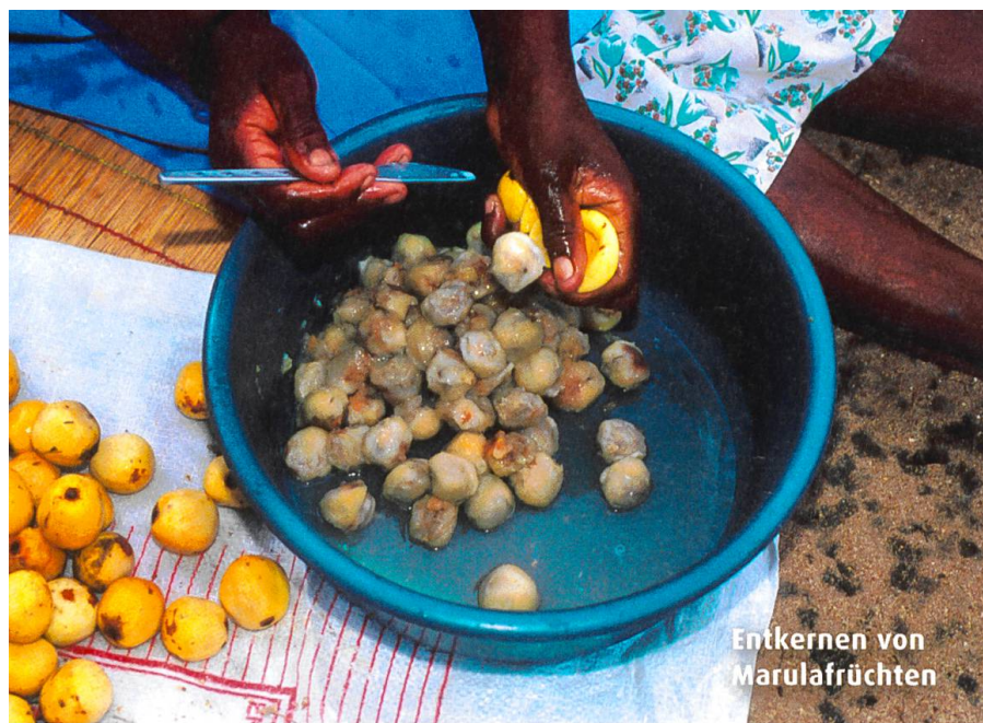
Entkernen von Marulafrüchten