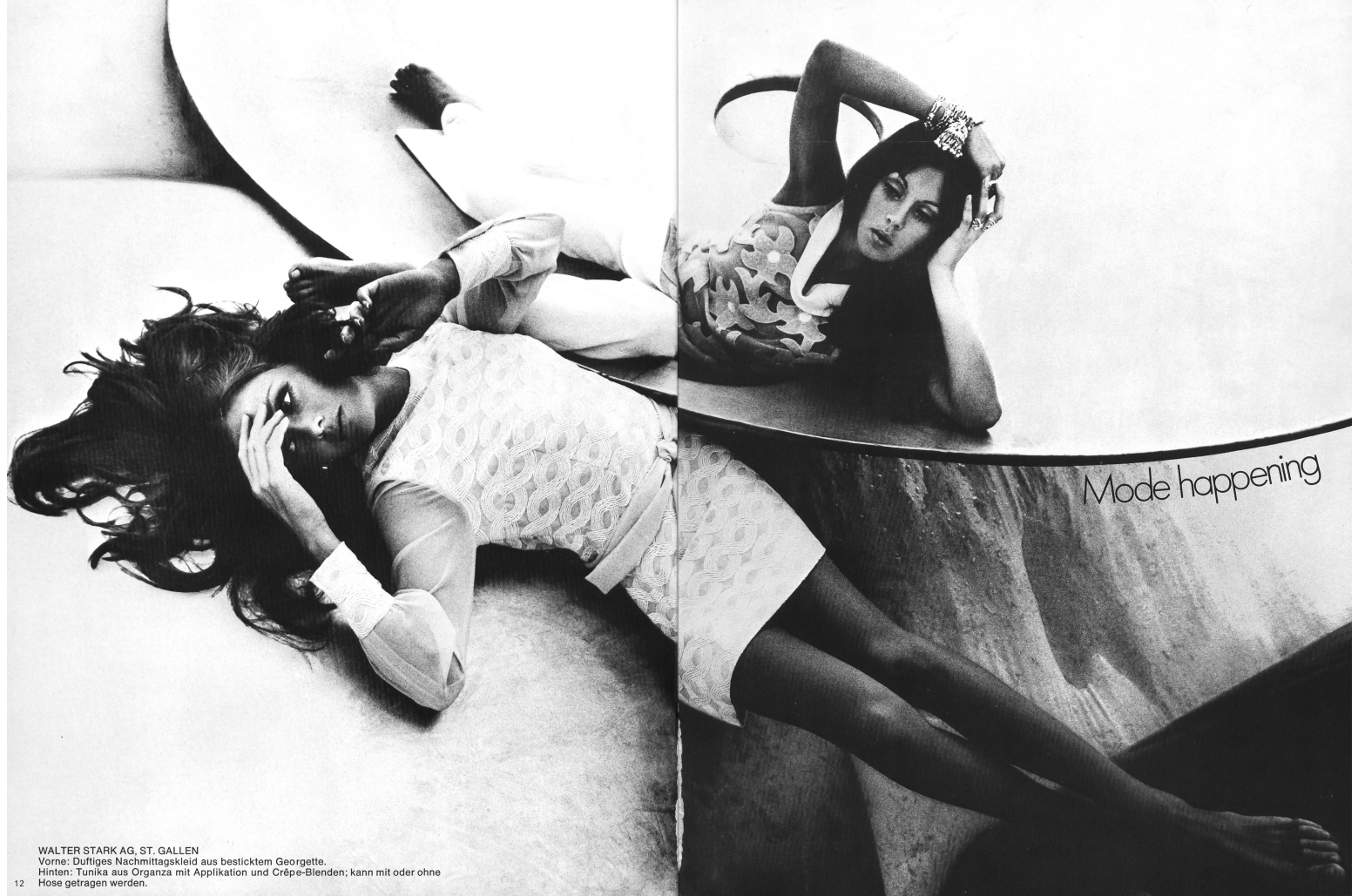
WALTER STARK AG, ST. GALLEN Vorne: Duffiges Nachmittagskleid aus besticktem Georgette. Hinten: Tunika aus Organza mit Applikation und Crêpe-Blenden; kann mit oder ohne Hose getragen werden.