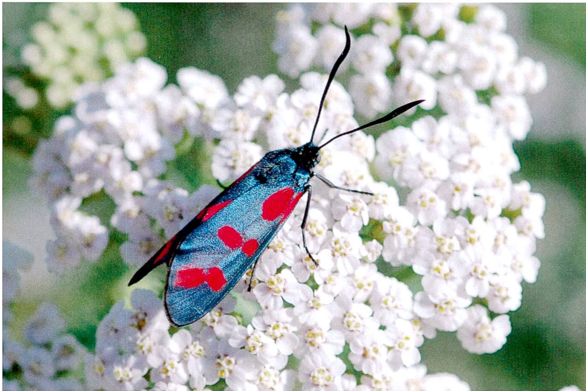
Abbildung 1: Gewöhnliches Widderchen.

Dunkler Dickkopffalter ( Erynnis tages , Linnaeus 1758): Der bereits früher seltene Falter galt nach 1985 im Thurgau als verschwunden. 2004 wurde er in der Ochsenfurt wiederentdeckt. Dort hat sich inzwischen eine grössere Population entwickelt, und die Art breitet sich von dort immer weiter aus. 2008 wurde der Falter auch im Untersuchungsgebiet in der Trockenwiese 8 und deren westlicher Verlängerung ( Fläche 7 ) festgestellt.