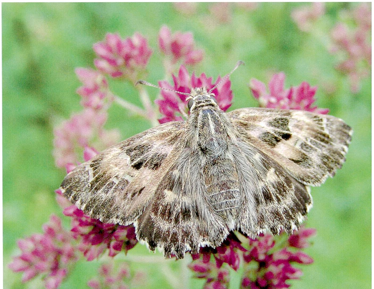
Abbildung 2: Malven-Dickkopffalter.

Zitronenfalter ( Gonepteryx rhamni , Linnaeus 1758): Sein Lebensraum sind Waldränder, Waldwiesen, Parkanlagen und Gärten, wo seine Raupen-Futterpflanzen Faulbaum oder Kreuzdorn wachsen. Der Zitronenfalter schaltet sowohl nach dem Schlüpfen im Sommer als auch über den Winter je eine lange Ruhepause ein und überwintert als Falter. Mit über elf Monaten Lebensdauer wird er von keiner anderen einheimischen Art übertroffen. Auch diese Art war gegen Ende des letzten Jahrhunderts während Jahren bei uns fast verschwunden, ist jedoch wieder merklich häufiger geworden.