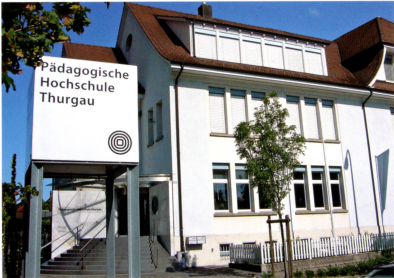
PHTG-Hauptgebäude, Nationalstrasse 19, in Kreuzlingen, noch bis Sommer 2008.

zum Rednerpult, das umgeben ist von sommerlichem Blumenschmuck. «Alles lernen ist einen Pfifferling wert, wenn die Freude dabei verloren geht», ist das Motto seiner Begrüssung, zitiert nach Heinrich Pestalozzi. Interessant, wie unterschiedlich Vorbildung und persönlicher Hintergrund der frisch Diplomierten sind, die jüngste ist noch keine 21 Jahre alt, die älteste bald 50. Zwei Frauen bringen ihre Kinder mit, die während ihrer Ausbildung geboren wurden. Zwölf angehende Lehrkräfte kommen nicht aus dem Thurgau, drei aus Süddeutschland. Und was auffällt: Nur zwanzig Männer nehmen aus der Hand ihrer Mentorin oder ihres Mentors das Diplom samt Blumenstrauss entgegen. Rund zwei Drittel der frisch diplomierten Primarlehrkräfte besuchten vor der Pädagogischen Hochschule die Pädagogische Maturitätsschule Kreuzlingen (PMS, vormals Seminar) und konnten auf Grund der dort integrierten beruflichen Grundausbildung direkt ins zweite Jahr der dreijährigen Ausbildung an der PHTG eintreten. Was also im Vorfeld der PHTG v.a. ausserhalb des Kantons eher skeptisch gesehen wurde, be-